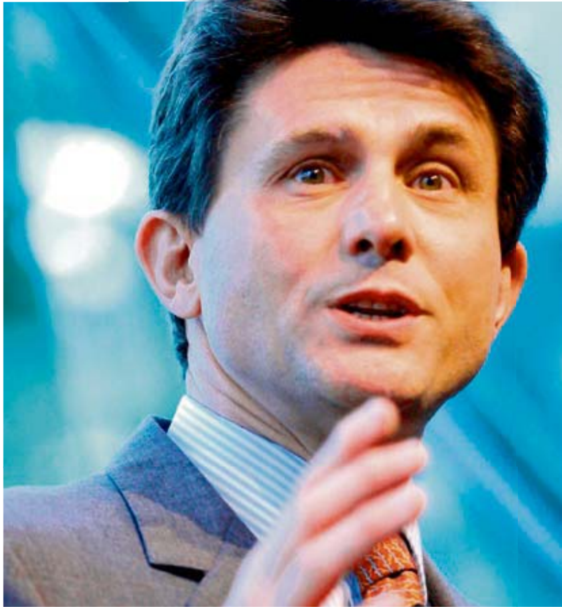
Axa-Chef Henri de Castries: «Es ist wie in der Wildnis, es überlebt, wer am schnellsten rennt»