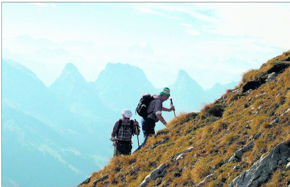
Diese zwei älteren Berggänger bewegen sich aufwärts, im Gegensatz zur Börse.